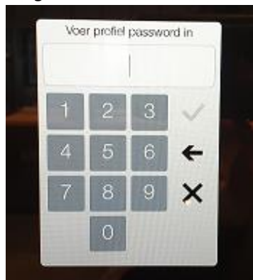
Inlog scherm - Password : 2222