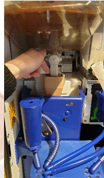
Plaats Espresso tabletreiniging