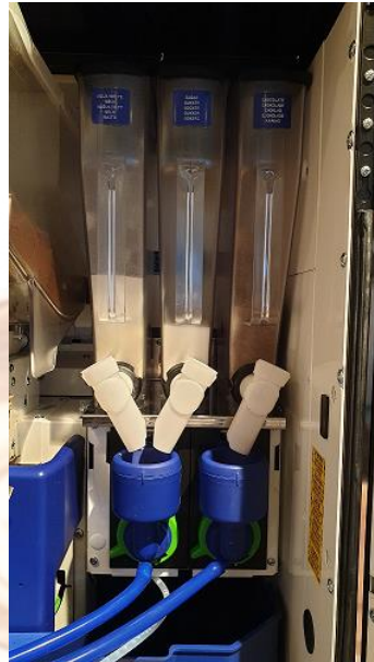
Product container Witte uitlopen container. Blauwe mengbeker