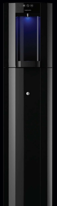
Zwart – Vloeropstelling