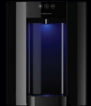
Zwart – Aanrechtmodel