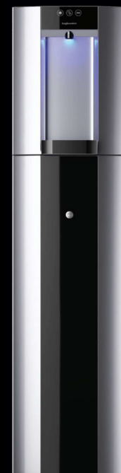
Zilver – Vloeropstelling