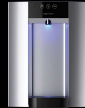
Zilver – Aanrechtmodel